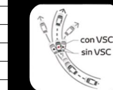
Control de estabilidad del vehículo VSC