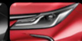
Rojo mica metálico