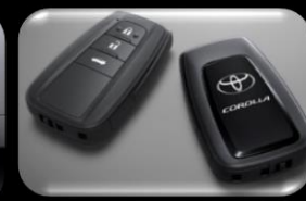
Control de entrada inteligente