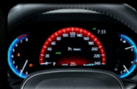
Pantalla multifuncional 7"