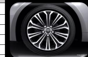
Rines de aleación de 17"