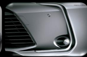
Luces anti-neblina LED