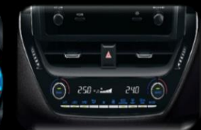
Aire acondicionado Bi-zona